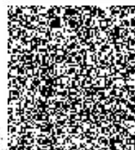
brig. .... Hlinovský kupující