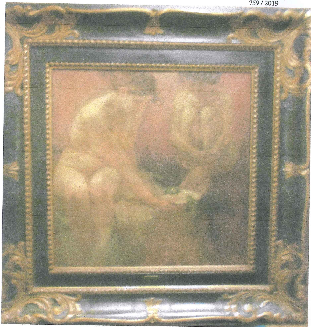
foto 1 - celkový pohled