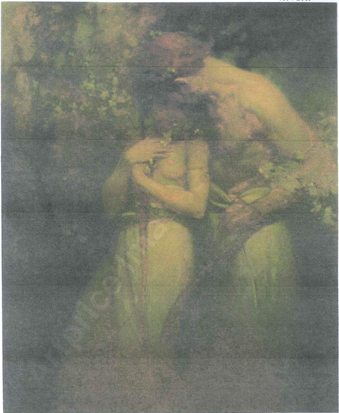
foto 4 – srovnávací práce – Jarní noc , olejomalba na plátně, 99,5 x 75 cm, okolo 1910, vydraženo za 96.000,- $ Sotheby's, 6. 10. 1997