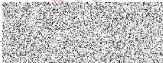
vedoucí Odboru školství Krajského úřadu Středočeského kraje