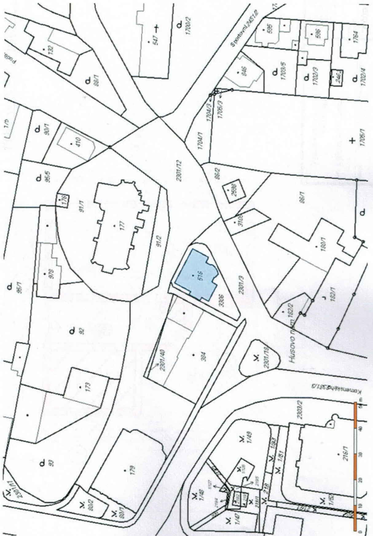
Příloha č. 1 k nájemní smlouvě