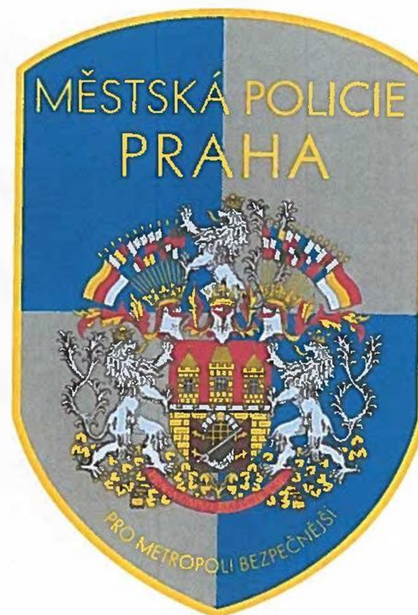
varianta 2 (týká se pouze slavnostního stejnokroje)