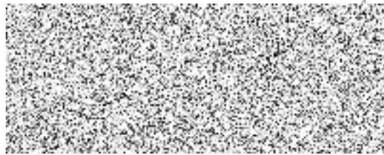
Plavecký klub Tachov, z.s. zastoupený Lenkou Katonovou předsedkyní klubu