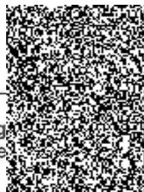
Mgr. Ing. ... náměstek ředitele ... telství