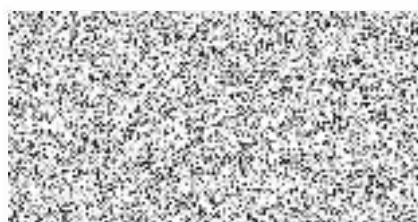
jednatel společnosti ZAAM, s.r.o.