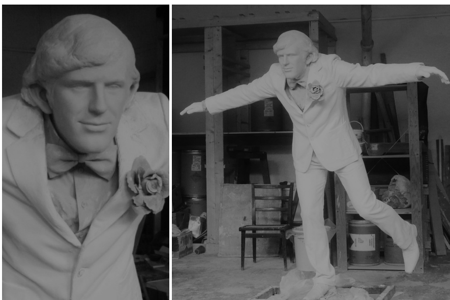
Model - stav 2015 - 2017