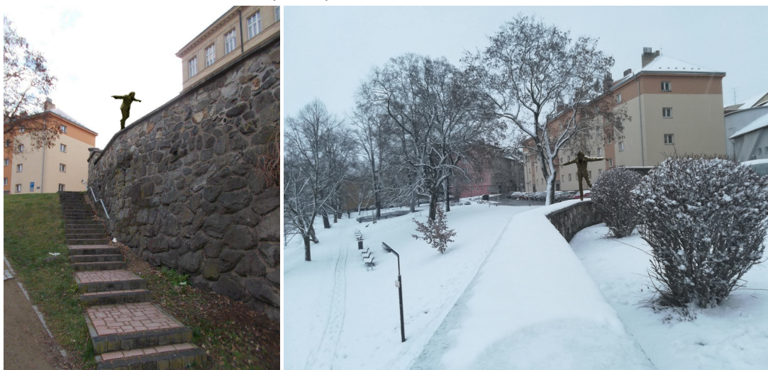
Orientační vizualizace - přesná pozice a orientace! bude upřesněna na základě vzájemné dohody