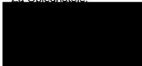
Mgr. Jiří Zemánek 1. náměstek hejtmána