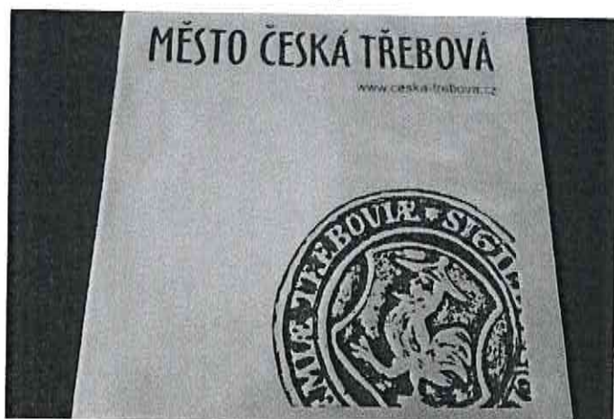
Obr. č. 5 – potisk komodit č.: 18, 19

MĚSTO ČESKÁ TŘEBOVÁ www.ceska-trebova.cz