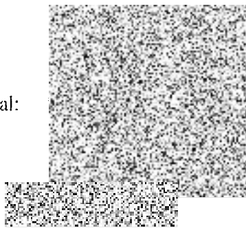
Mgr. Ivana Stráská starostka města Milevska