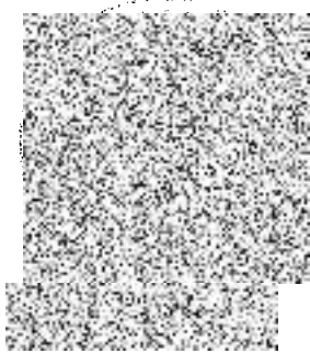
Mgr. Ivana Stráská starostka města Milevska