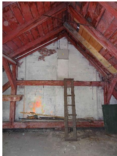
ESN.18 – umístění rozvaděče stávající sirény, v podkrovním prostoru