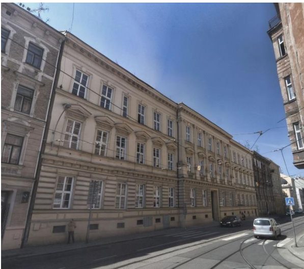
ESN.18 – stávající siréna na střeše objektu

Stávající rotační motorová siréna bude demontovaná a nahrazena novou sirénou elektronickou, uchycenou na stávajícím ocelovém stožáru přes stávající přípojovací přírubu. Půda je přístupná výlezem z posledního nadzemního podlaží.