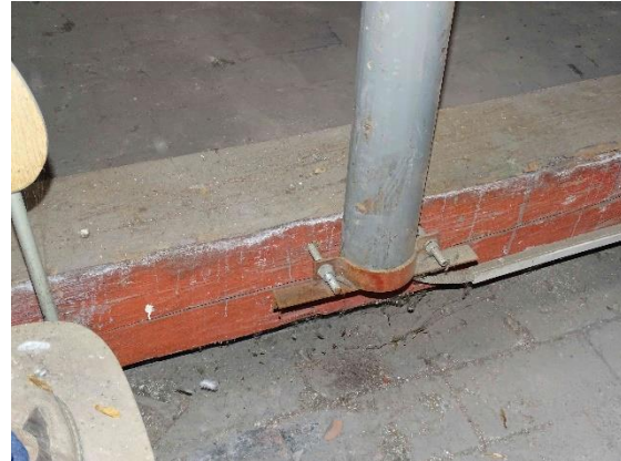
ESN.18 – kotvení stožáru stávající sirény, v podkrovním prostoru