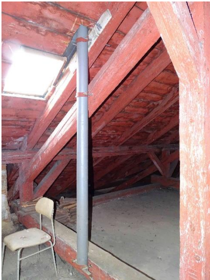
ESN.18 – stávající stožár sirény

Siréna bude začleněna do JSVV provozovaného HZS Jihomoravského kraje, kde dodavatel požádá o přidělení kmenového listu. Elektronická siréna dále umožní místní předávání verbálních informací prostřednictvím mikrofonu v řídicí skříni, rádiového modulu VIS, rádiového přijímače FM a GSM modulu integrovaného v ovládací skříni sirény a mobilního telefonu.