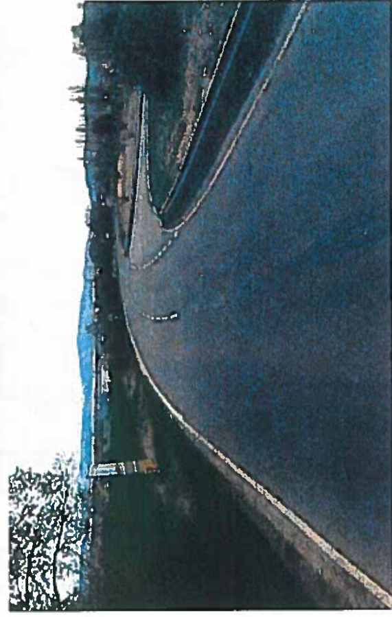
Silnice II/279 a III/27917 Svijany, rekonstrukce silnice