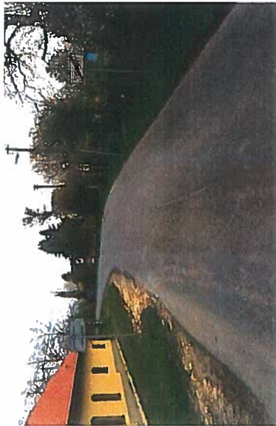
Silnice II/279 a III/27917 Svijany, rekonstrukce silnice