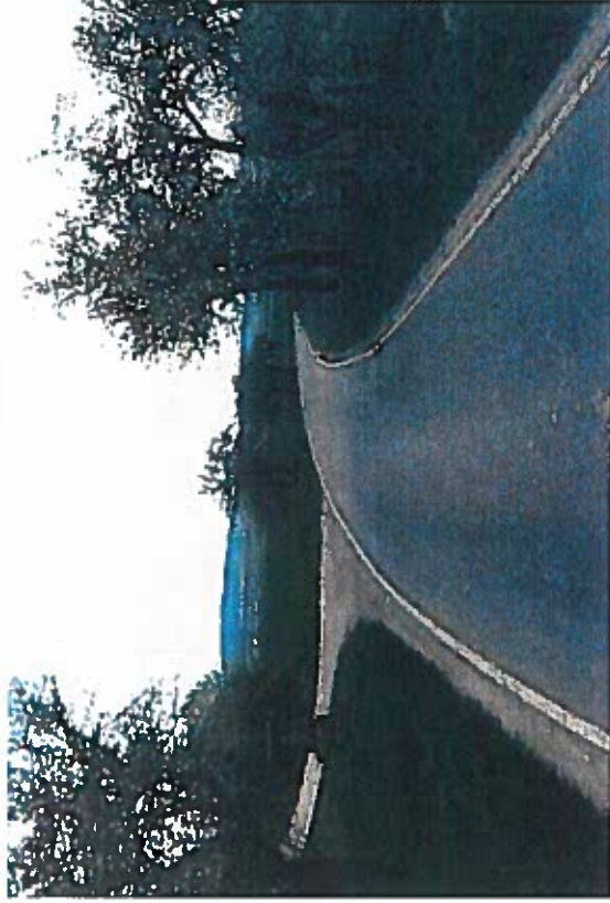
Silnice II/279 a III/27917 Svijany, rekonstrukce silnice