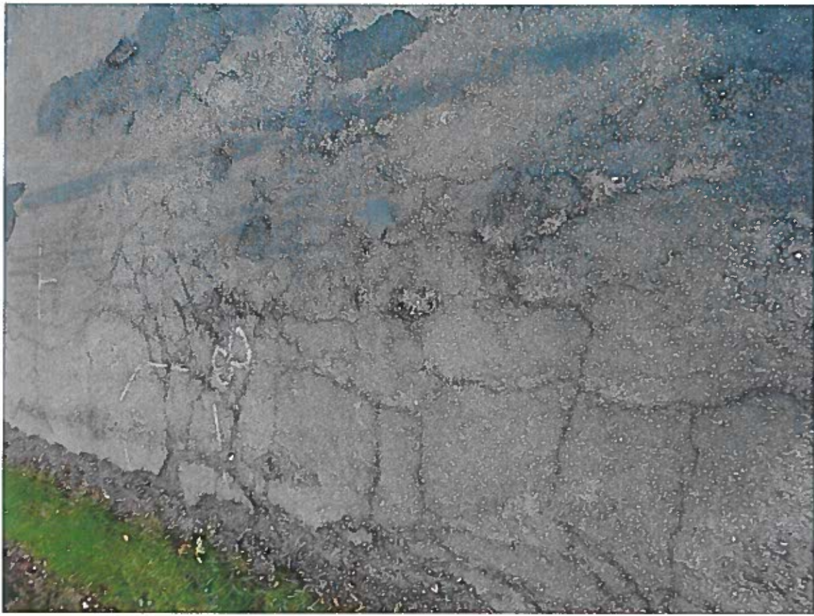
Silnice III/2784 Starý Dub – Světlá, Rekonstrukce silnice