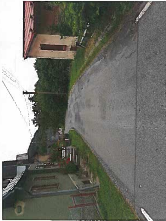
Silnice III/2784 Starý Dub – Světlá, Rekonstrukce silnice