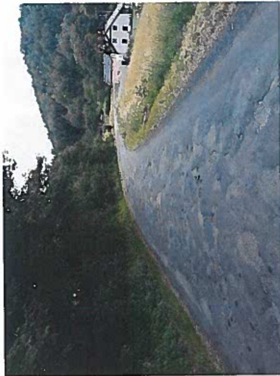
Silnice III/2784 Starý Dub – Světlá, Rekonstrukce silnice