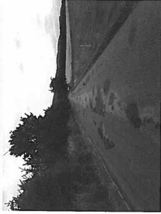
Silnice III/2784 Starý Dub – Světlá, Rekonstrukce silnice