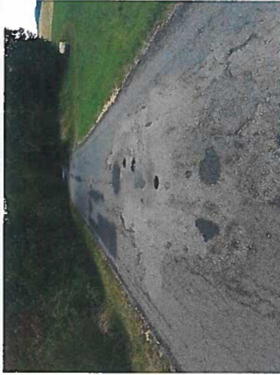
Silnice III/2784 Starý Dub – Světlá, Rekonstrukce silnice