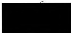
Ing. Jiří Svoboda, primátor statutární město České Budějovice