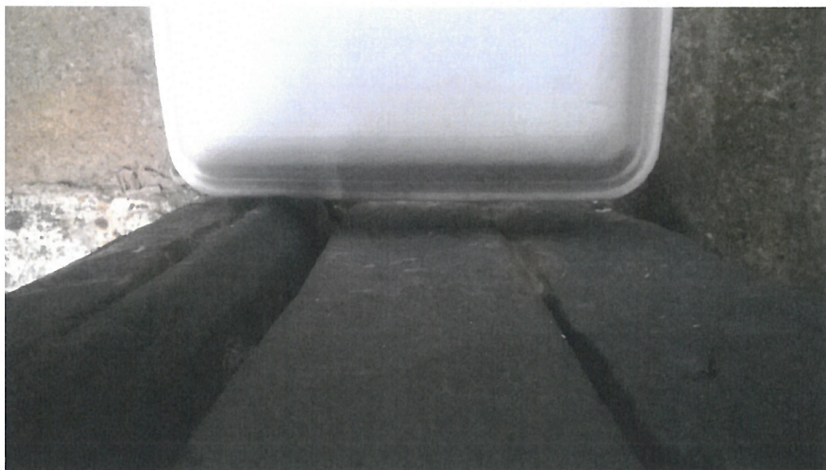
Prává půlka při otevření je vyosená a svěšená.