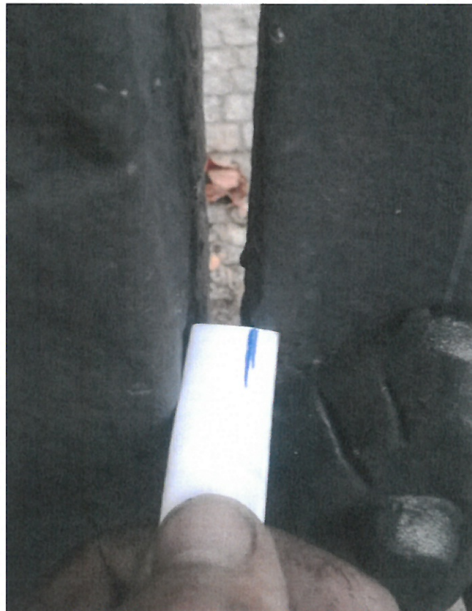
Mezera levé a pravé půlky při zavření brány.