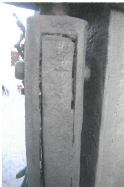
Spodní a horní pant levé půlky.