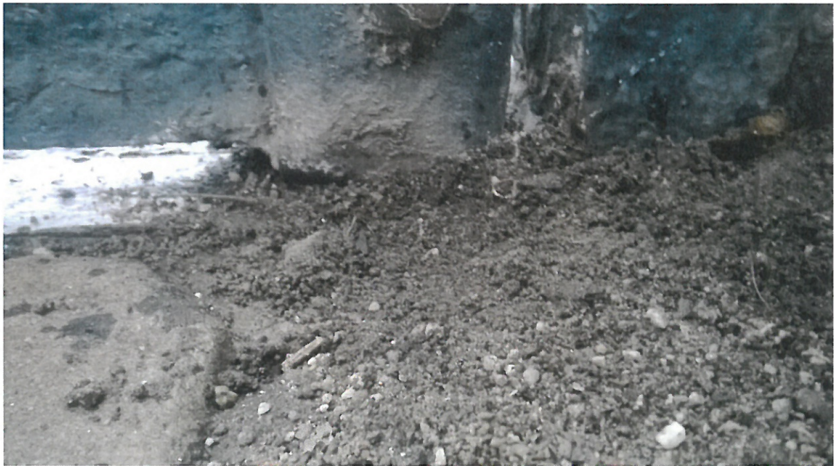
Spodní pant v písku a šterku.