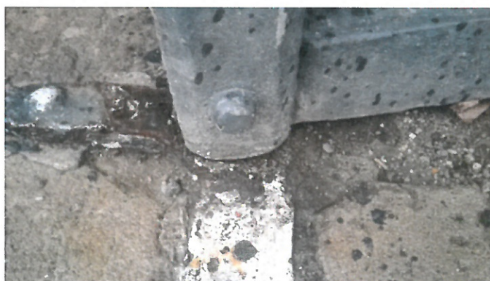
Spodní pant pravé půlky.