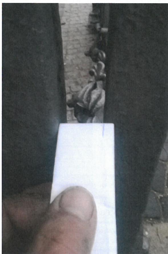
Mezera levé a pravé půlky při zavřené bráně.