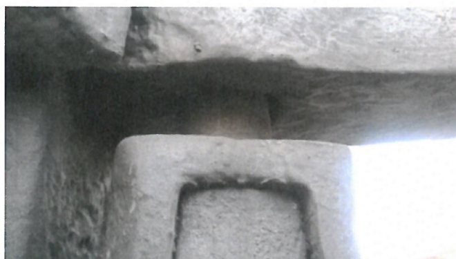
Horní pant pravé půlky.