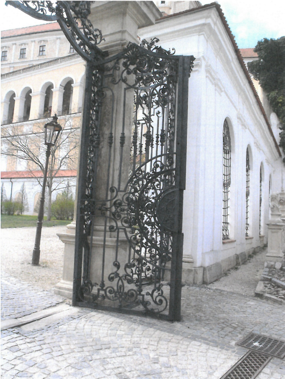
Svěšené pravé křídlo brány.