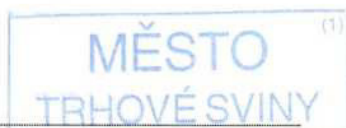
Pavel Randa starosta města