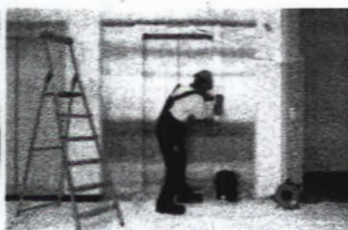
Servis 24 hodin