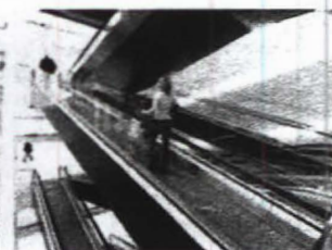
Eskalátory & pohyblivé chodníky