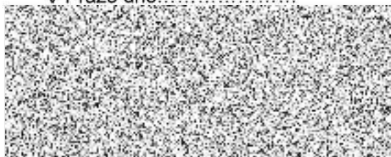
ředitel odboru strategie a evropských záležitostí za Objednatele