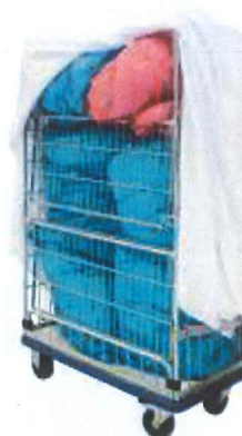
Kontejner s použitým prádlem

Použité prádlo je zákazníkem tříděno do pytlů, které pak vhazuje do přepravního vozíku se sklopnou policí, v němž bylo dovezeno čisté prádlo.