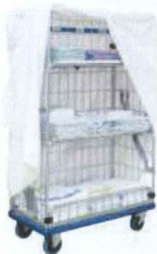
Kontejner s čistým prádlem

Profesionálně vyškolení pracovníci společnosti CHRISŤOF poskytují zákazníkovi odborný poradenský servis před zavedením i v průběhu celé služby a volba optimální varianty komplexního servisu pro daného zákazníka zaručuje zefektivnění toku finančních nákladů.