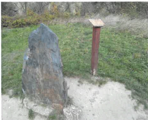
kámen č. 6 – jílovitá břidlice