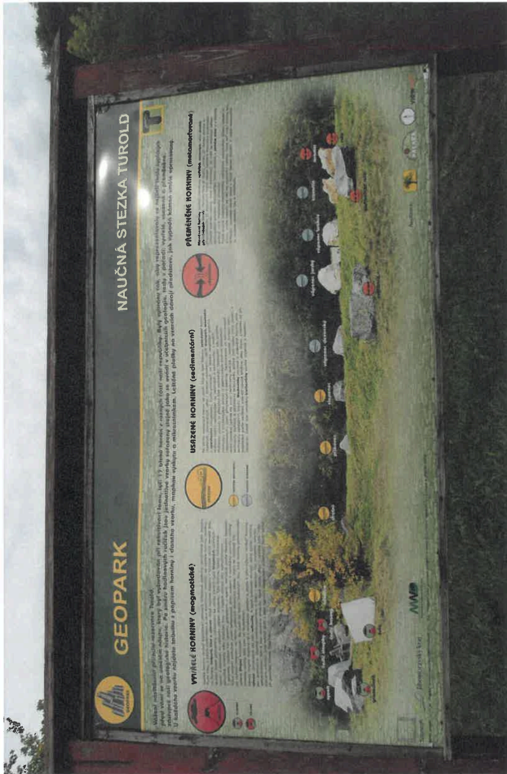
foto – úvodní panel