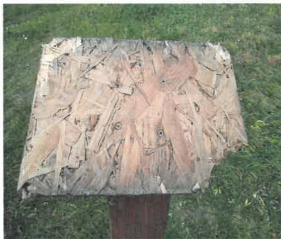
infotabulka (text chybí):