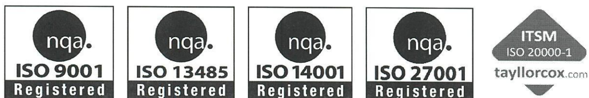
Obrázek 1: Certifikace ICZ a.s.