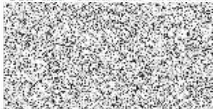
za zhotovitele Ing. Ladislav Sirový ředitel