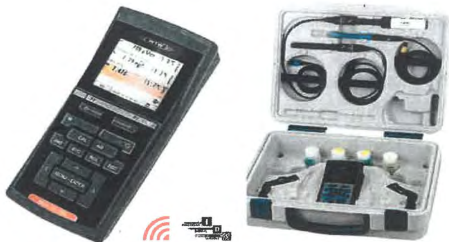
Ilustrační obrázek 2FD57F