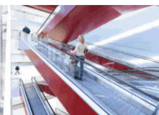
Eskalátory & pohyblivé chodníky