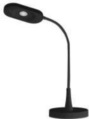
Led lampička HT6105

snadná údržba, suché k žehlení, suché do skříně, suché do skříně extra, dodatečné programy, mix, sportovní oblečení, super 40, časování 30 min., studené, časování 30 min. teplé, bavlna, peří, trička / halenky, ručníky, bílé / barevné