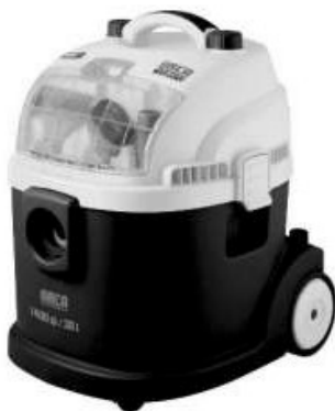
vysavač SENCOR SVC 3001 Wet & Dry

Max. příkon 1400W Sací výkon 250W 5 stupňový systém filtrace 1 parkovací poloha pro podlahovou hubici Akční rádius 7,5 m (délka přívodního kabelu 5 m) Automatické navíjení kabelu Elektronická regulace sacího výkonu Univerzální podlahová hubice s výsuvným kartáčem Speciální hubice na vysávání vody Objem sáčku na prach: 7,5 l Objem nádoby pro mokré vysávání: 16 l Celkový objem nádoby: 30 l Rozměry (šířka x hloubka x výška): 374 x 425 x 490 mm Hmotnost: 7,9 kg