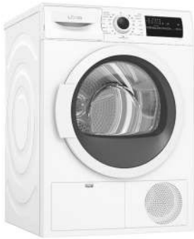
Sušička Lord T1

kategorie: volně stojící energetická třída: A++ maximální náplň: 8 kg objem: 112 l hlučnost: 65 dB rozměry: 84,8 × 59,8 × 63,6 cm