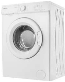
Pračka Philco PL 1062

Energetická třída A++ Náplň 6 Kg Otáčky 1000 ot./min Hlučnost praní/odstředování 58/78 dB Roční spotřeba energie 171 kWh Roční spotřeba vody 9 900 l Rozměry výrobku ( VxŠxH ): 84,5x59,7x49,7 cm