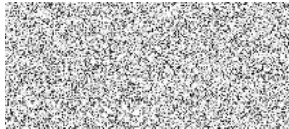
ŠKODA AUTO a.s.