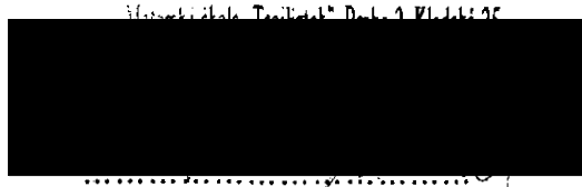
Pavla Suchopárová ředitelka