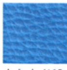
vzor Koženky - ilustrační obrázek