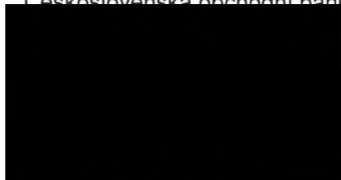
Lucie Šmejkalová Klientský pracovník pro FIB - II