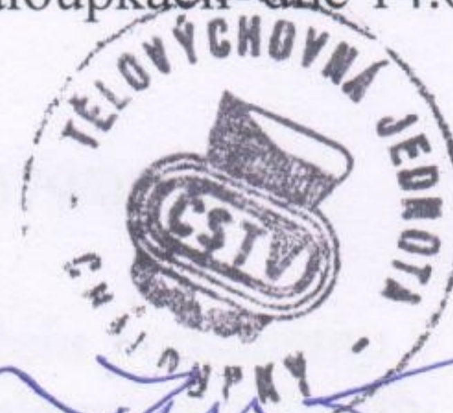
..... předseda spolku za příjemce dotace