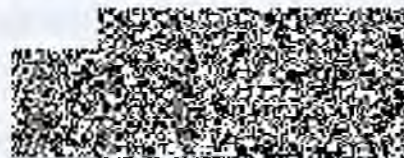
Podpis a razítko kupujícího