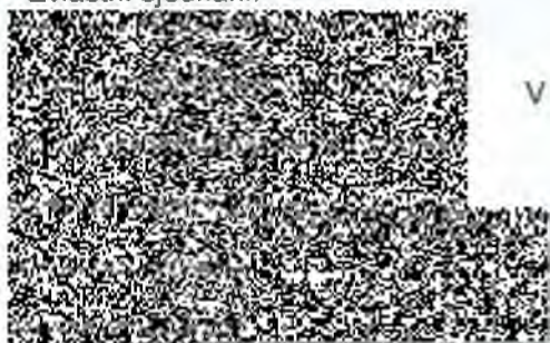
Podpis a razítko prodávajícího