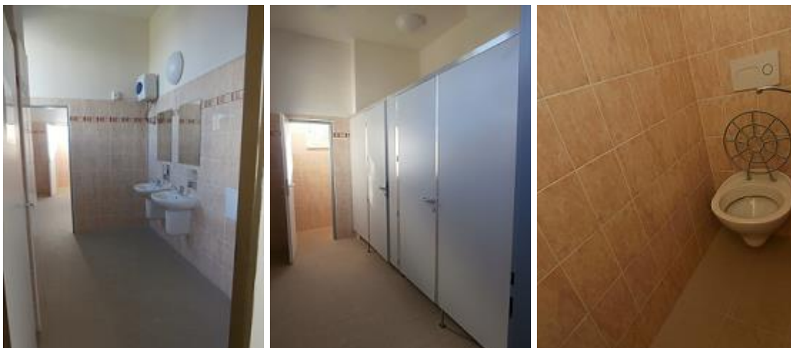
Stávající dívčí WC ve 2.NP pavilonu D