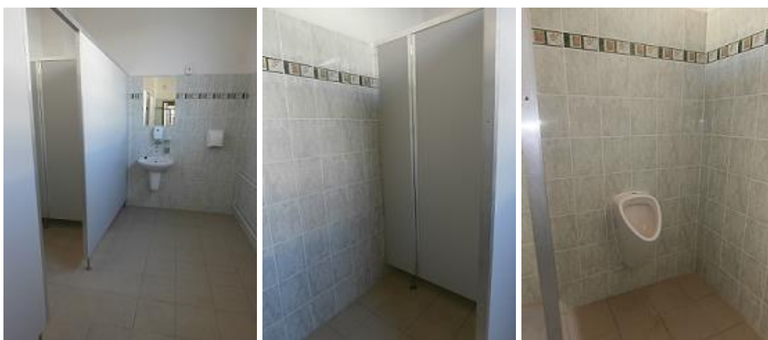
Stávající chlapecké WC ve 2.NP pavilonu D