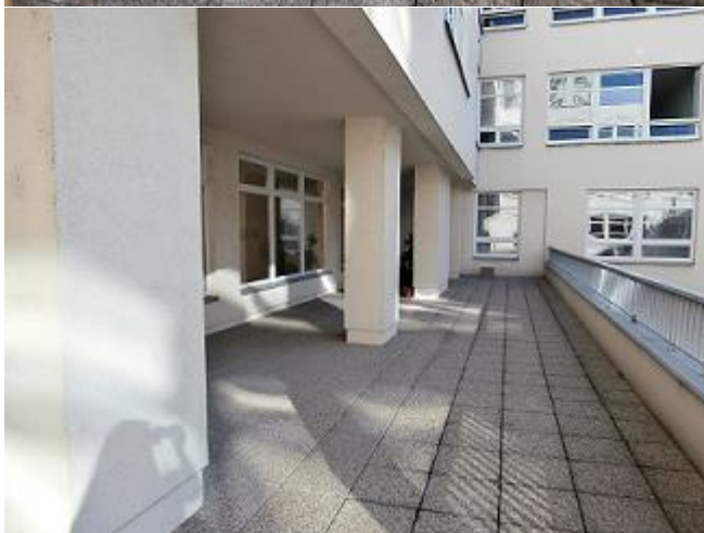
Terasa určena pro zřízení odborné učebny pěstitelství

Součástí požadavku je také výsadba okrasných dřevin, které budou umístěny v areálu zahrady a také doplnění bezpečnostních kamer u všech vstupů do objektu.