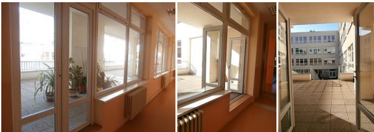
Vstup na terasu z chodby