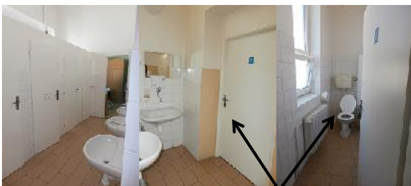
Stávající dívčí sociální zařízení ve 3.NP, včetně učitelského