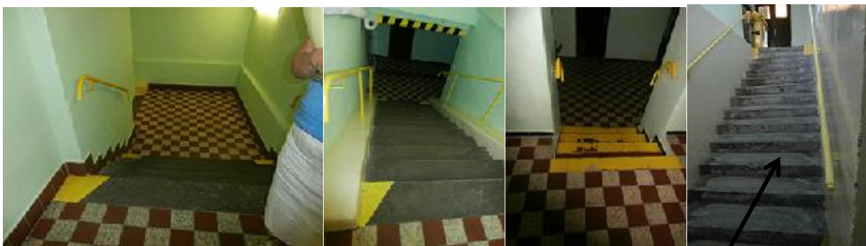
Schodiště vedoucí z šaten