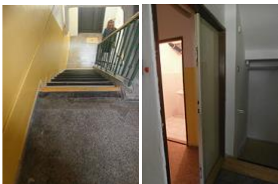
schodiště a vstupní dveře do cvičné kuchyně