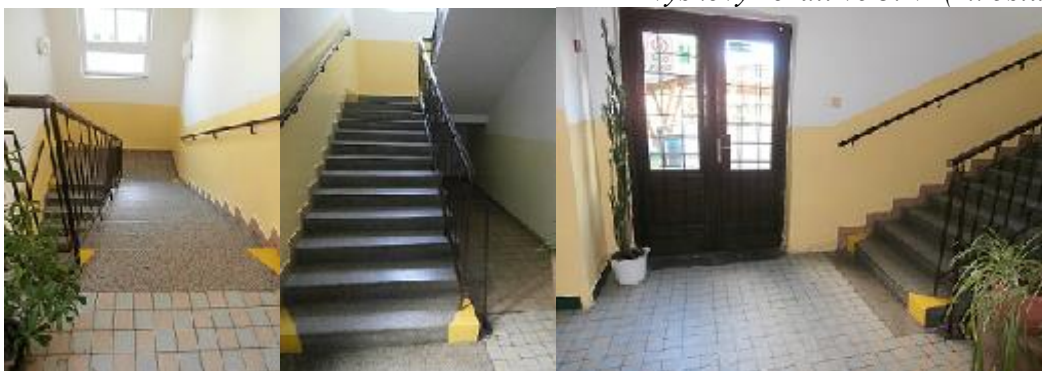
Schodiště určené k doplnění el. plošiny