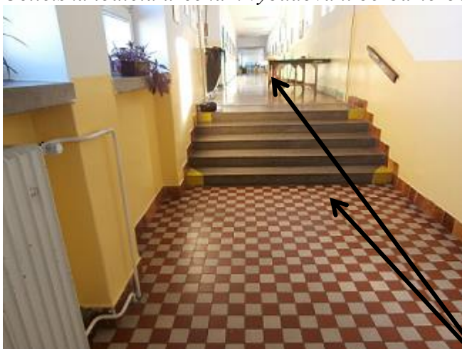
výškový rozdíl ve 3.NP (2x 5stupňové schodiště)