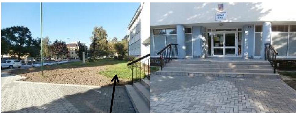
Umístění nájezdové rampy