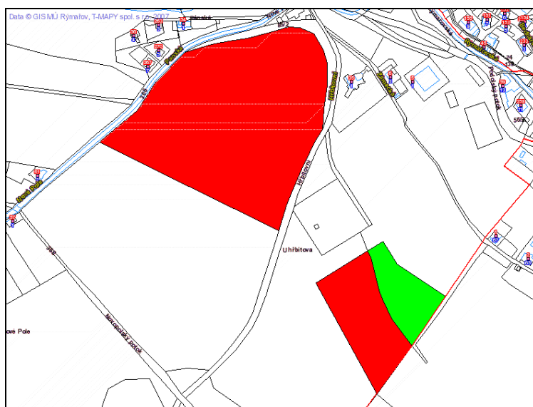
JANOVICE U RÝMAŘOVA parc. č. 86/2, 81/2 a 80/3