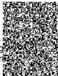
Mgr. Ing. ekonom

FRANKOSPOL OFFICE s.r.o. Svazarmovská 309 738 01 Frýdek-Místek tel: 555 531 600, fax: 555 531 610 IČ: 25910027 DIČ: CZ25910027