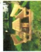
prostorá oplocení, kulec