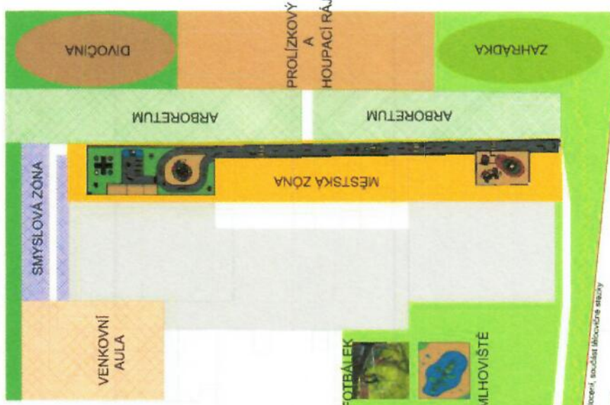
prostorá oplocení, součást tělocvičné stezky