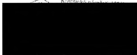
zhotovitel Jiří Mouček jednatel JIKOMSTAV s.r.o.

Niže podepsaní členové Zastupitelstva městské části Praha 4 potvrzují, že jsou v případě tohoto právního úkonu splněny podmínky uvedené v ustanovení § 43 zákona č. 131/2000 Sb. o hlavním městě Praze.