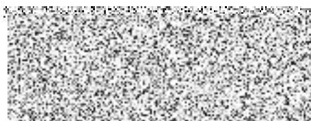
MVDr. Josef Rihák radní pro oblast majetku a ICT

Při fakturaci uvádějte číslo naší objednávky. Faktury bez tohoto označení Vám budou vráceny k doplnění. Splatnost Vámi vystavené faktury musí být nejméně 14 kalendářních dnů.