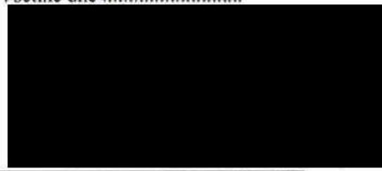
za Vodovody a kanalizace Vsetín, a.s. ) [redacted], ředitel