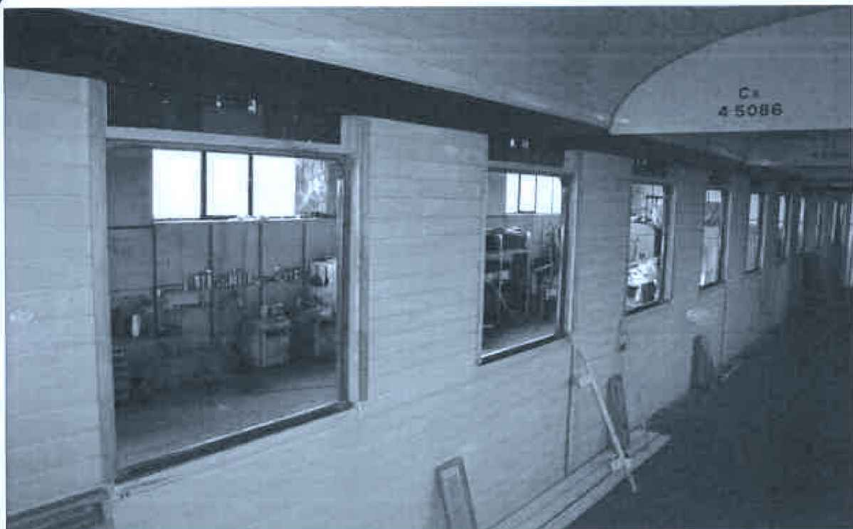
Palubkové obložení stěn v základové barvě