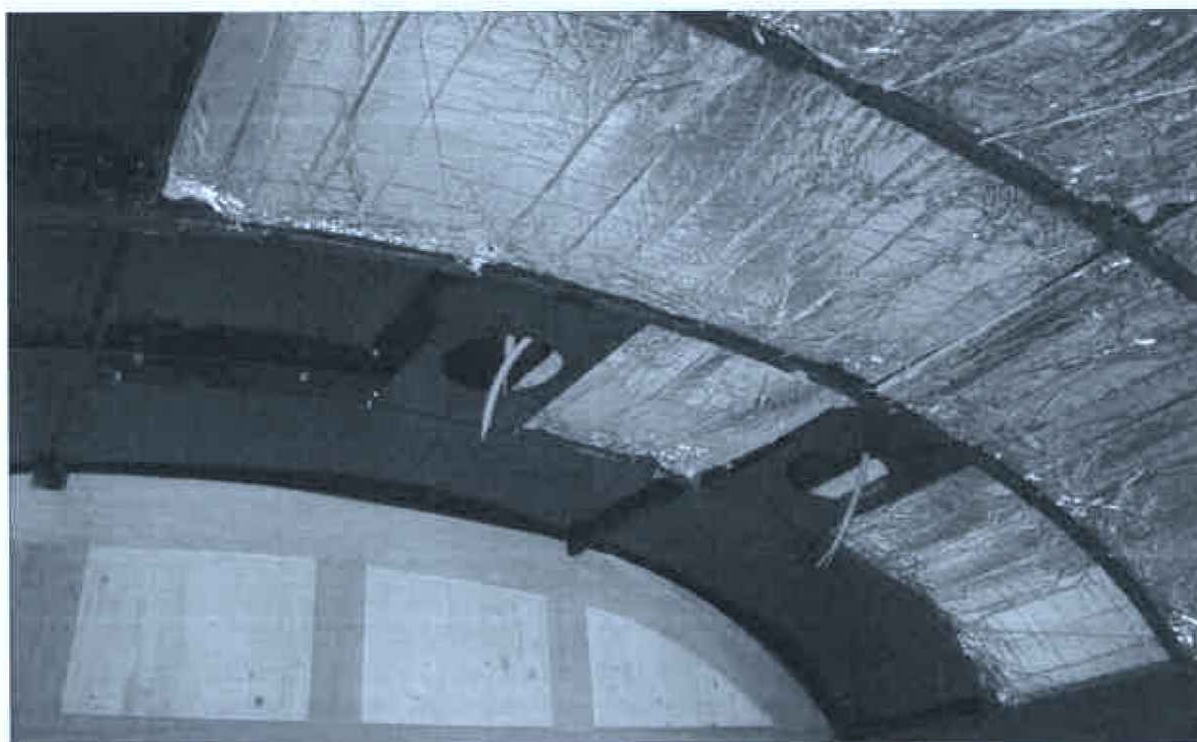
Moderní vatová izolace použita po celém obvodu vozu