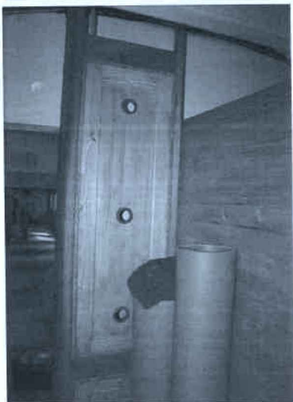
Vestavba záchodových buňek