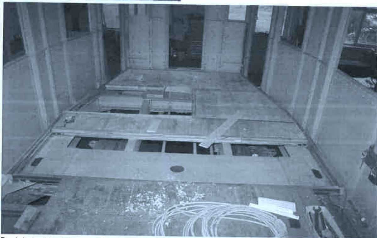
Doplnění vyžilých částí podlahy nově zhotovenými