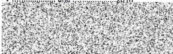
FCC BEC, s.r.o. Zhotovitel