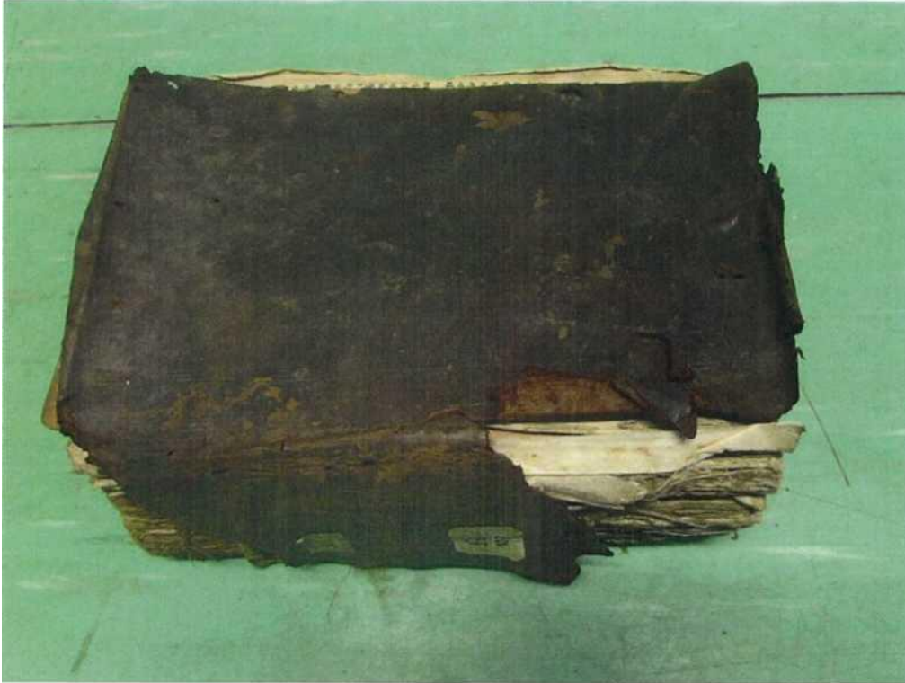
Celkový pohled na objekt. 2