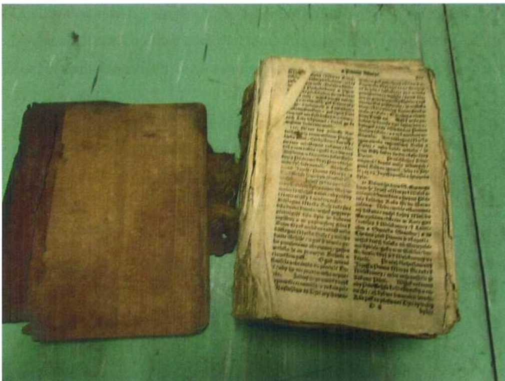
Pohled na začátek knihy, viditelné poškození organizmu šití a ztráta prvních listů knižního bloku.