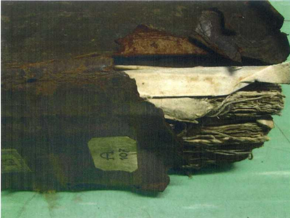
Detailní pohled na patu knihy a výraznou ztrátu pokrývového materiálu.