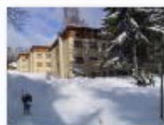
3 VOLAREZA Bedřichov - depandance zima