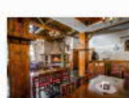
22 VOLAREZA Bedřichov - U Medvěda interier