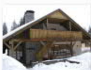
19 VOLAREZA Bedřichov - restaurace U Medvěda