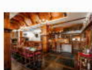
21 VOLAREZA Bedřichov - U Medvěda interier