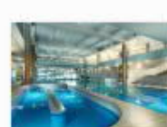
23 VOLAREZA Bedřichov Vodní ráj