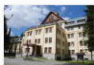
2 VOLAREZA Bedřichov - hlavní budova léto