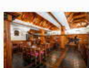
20 VOLAREZA Bedřichov - U Medvěda interier