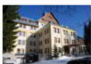
1 VOLAREZA Bedřichov - hlavní budova zima