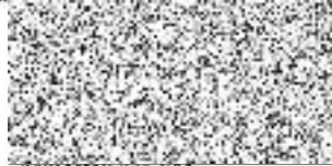
ředitel PRAHA 10 - Majetková, a.s.